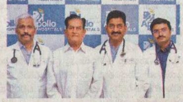
కరోనా నుంచి కోలుకున్న వృద్ధుడితో వైద్యులు

సట, శరీర, కీళ్ల నొప్పులు, ఏకాగ్రత లోపించడం తదితర సాధారణ